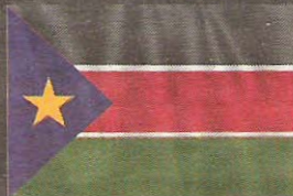
Vlag van Zuid-Soedan