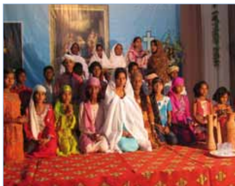
Toneelgroep straalt op Maria feest.

alleen mannen met geweren; vrouwen zag je zelden want die moesten binnen de ommuurde woningen blijven. Zoiets als de woning van Osama bin Laden in Abbottabad. In de hoofdstad van deze streek, Mingora, maakte ik kennis met opiumrokers, wat versufte mannen die slurpten aan hun met opium gevulde waterpijp. Opmerkelijk was de vriendelijkheid waarmee de