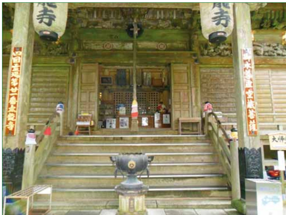
Opgang naar een tempel.

Kobo Daishi, de man die een bepaald soort boeddhisme naar Shikoku heeft gebracht, zei dat het nirwana gestalte krijgt op aarde, wanneer mensen gestalte geven aan zijn woorden, namelijk door een leven te leiden van eenvoud, onthechting, gastvrijheid, hulpvaardigheid. Nu ik deze zeer moeilijke tocht van ongeveer 1300 km. over steile bergen, in weer en wind, volbracht heb, meen ik dan ook dat ik dat koninkrijk en het nirwana ondervonden heb bij de ontmoetingen met enkele personen, die een beetje Engels spraken en met wie ik met mijn paar woorden Japans kon praten over hun levensvisie en ook bij de mensen die mij met een bijzondere gastvrijheid en hartelijkheid ontvingen in hun huizen. Ik heb ook mogen ervaren hoe mensen verder willen leven met die geweldige impact van een aardbeving, een tsunami en een kernramp. Hun conclusie is dezelfde als die wij missionarissen voorhouden aan mensen bij onze verkondiging van